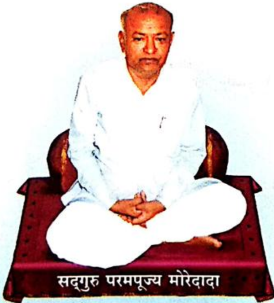
सद्गुरु परमपूज्य मोरेदादा